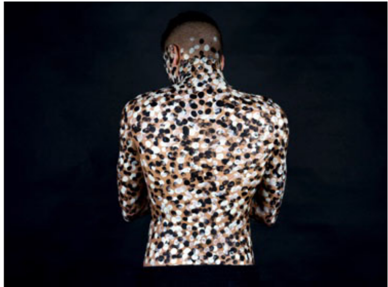
Mwangi Hutter On the Other Side of Midnight 2017 C-prints each 68 cm x 94 cm