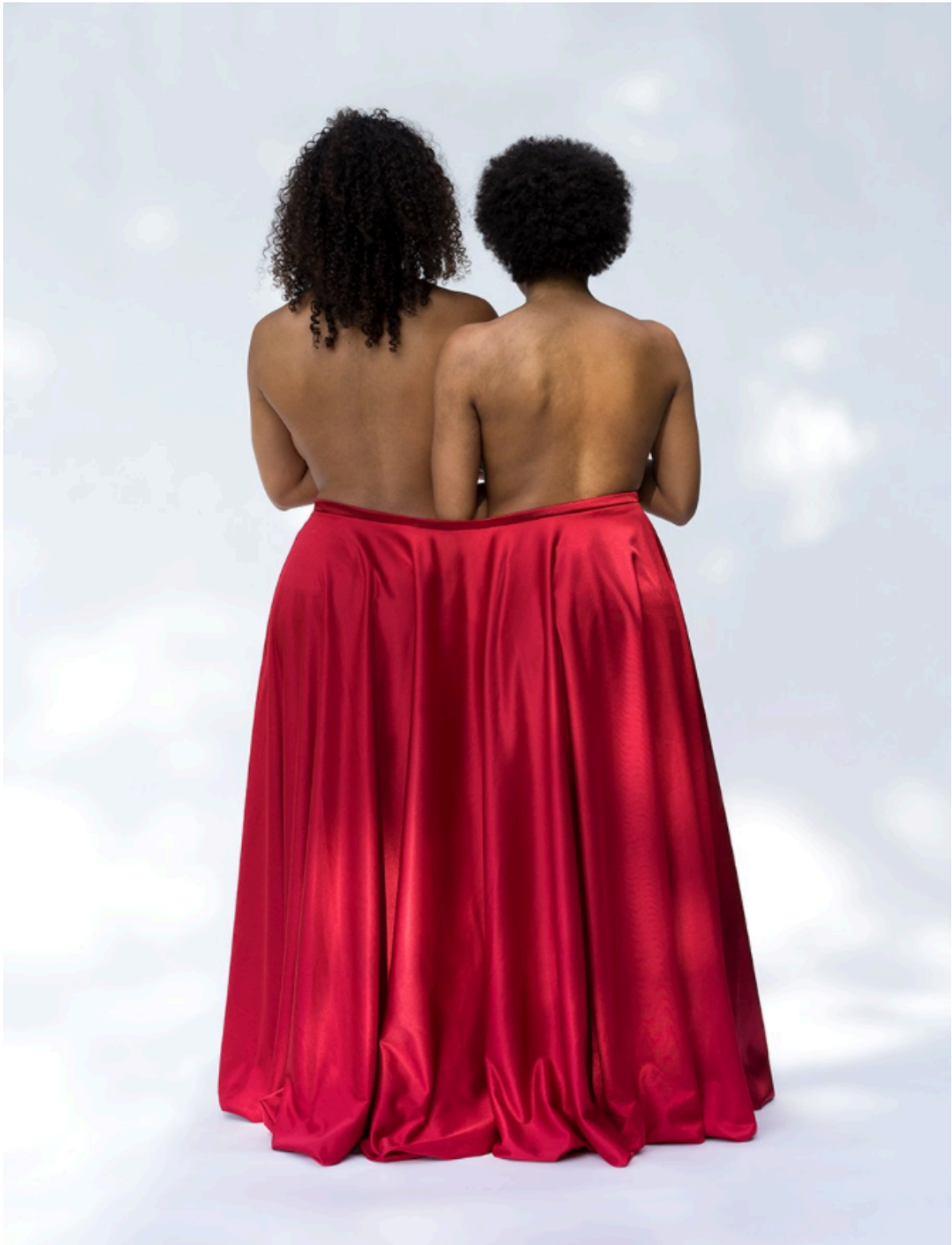
Mwangi Hutter Twinshipping 2016 c-print 110 cm x 84 cm