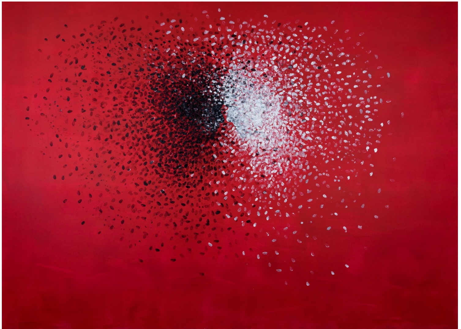
Mwangi Hutter I want to Live in Your Heart 2017 oil on canvas 210 cm x 290 cm